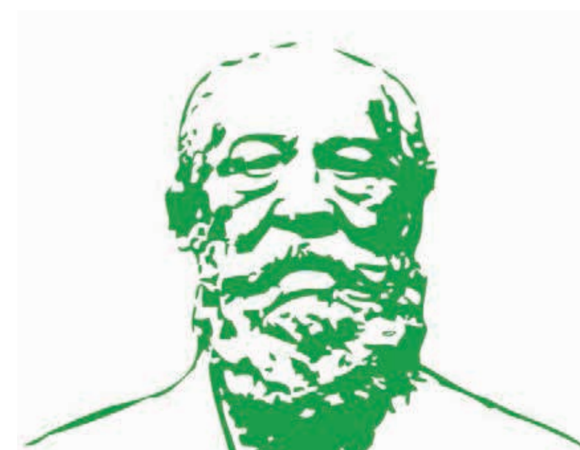
Prof. Hellriegel Institut

TV 6: Center of Food Science and Engineering