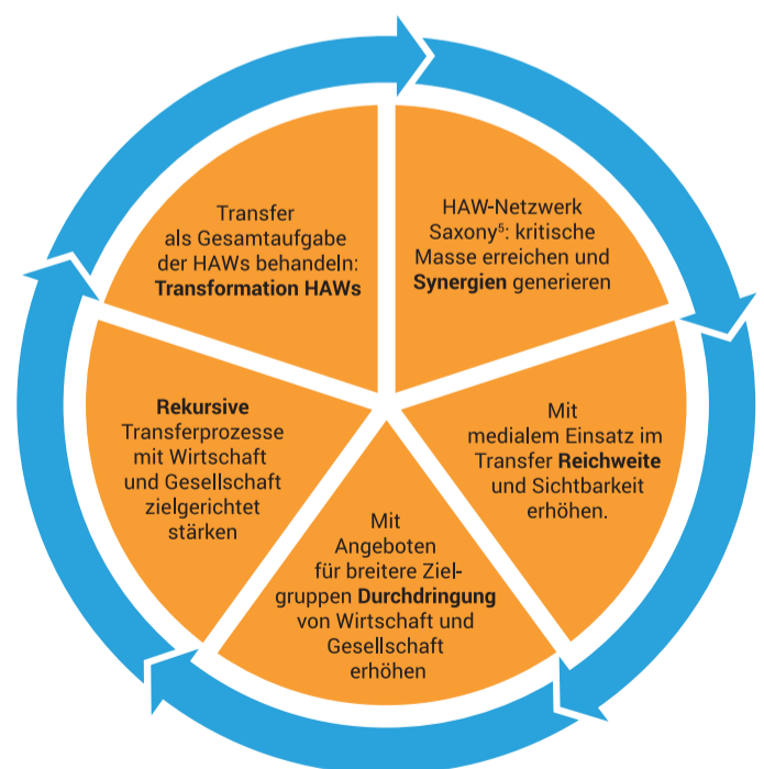
Transferstrategie von Saxony 5