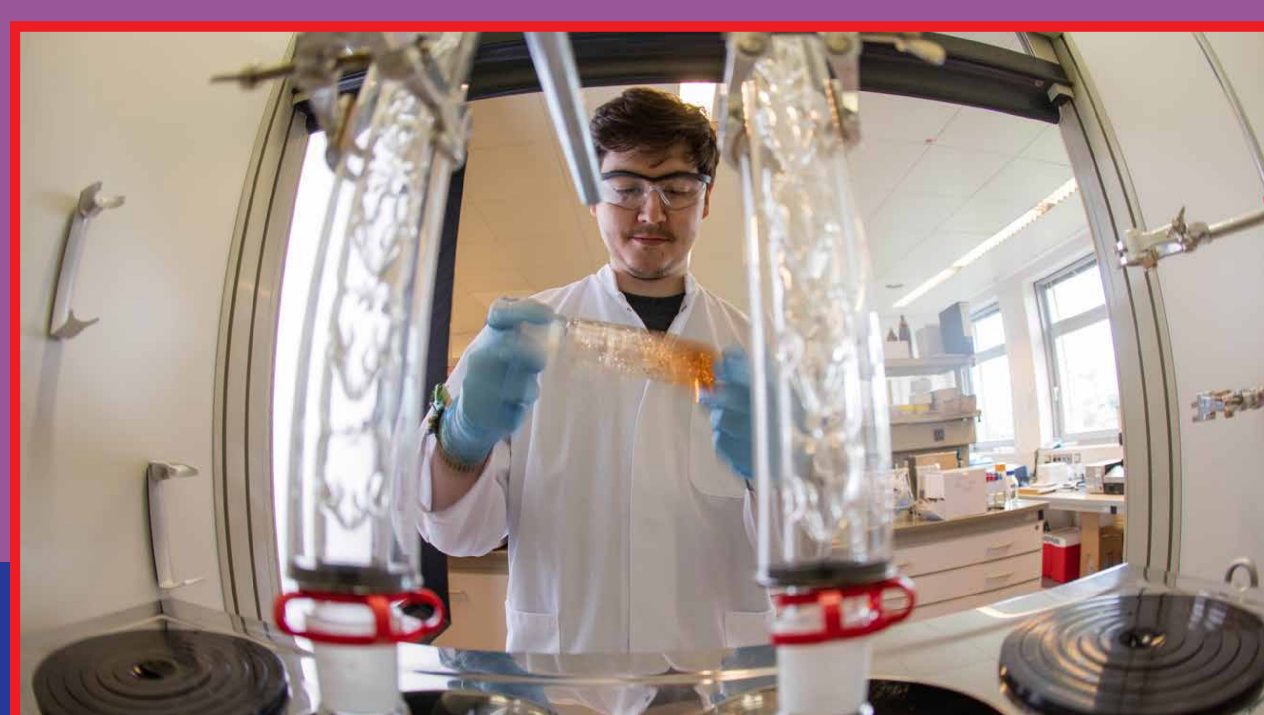
ZAIT Analytik für Produktinnovationen